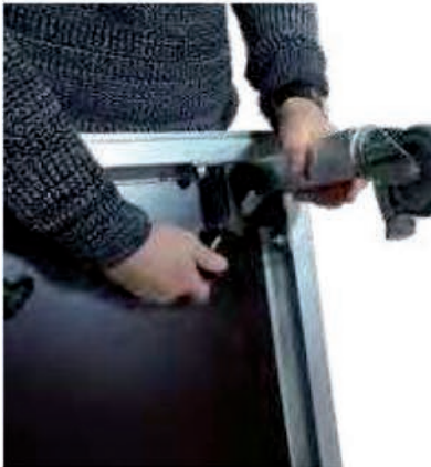
Einfache & werkzeuglose Montage der Steckfüße